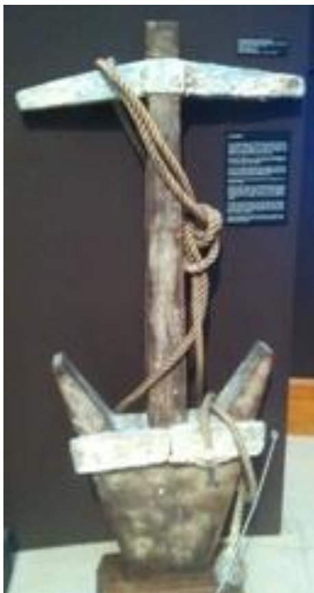
Ancre à jas (IIIème siècle après JC) Port de Monaco

Toutes les pièces archéologiques qui sont présentées au Musée d'Anthropologie préhistorique, sont les témoins d'une activité, d'un métier, d'une histoire ou de coutumes. Leur association dans cette exposition permet ainsi de comprendre un peu de l'Histoire de Monaco.