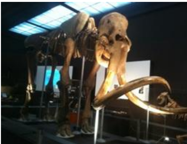
Mammouth laineux (Mammuthus primigenius) en provenance de Sibérie

Les remplissages de la grotte de l'Observatoire (situé dans l'enceinte du Jardin Exotique) et des sites exceptionnels des Balzi Rossi situés entre Menton et Vintimille, dont la grotte du Prince, sont de véritables livres ouverts sur l'histoire des climats et des hommes.