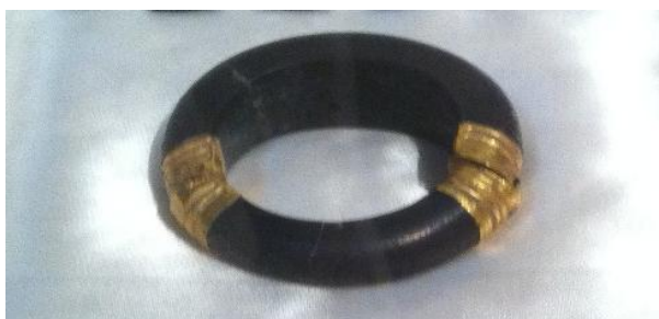
Bracelet en jais avec charnière en or (IIIème siècle après JC - Monaco)