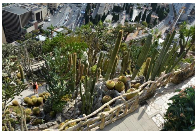
Le Jardin exotique

Dès lors, les équipes successives du Musée suivent avec enthousiasme les pas scientifiques du Prince-savant, et le fonds de l'institution s'enrichit. En 1959, le Prince Rainier III offre le plus beau des cadeaux au Musée : son transfert à proximité de la grotte de l'Observatoire au sein du Jardin exotique. Louis Barral (conservateur du M.A.P.) aménage alors le site et l'accès aux magnifiques salles de la cavité.