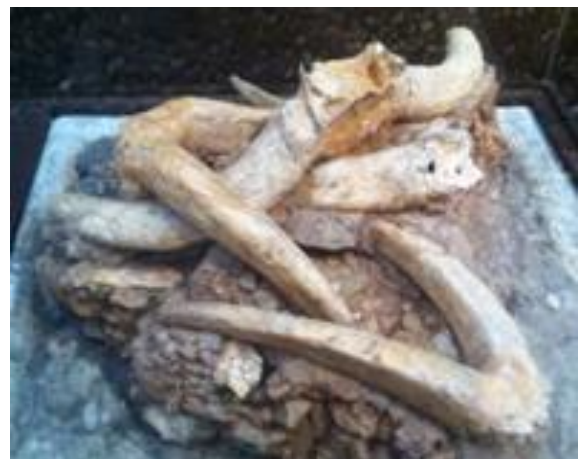
Assemblage anthropique de cornes de Bouquetins et de Bovidé

Cette salle présente, outre le squelette complet d'un Mammouth laineux, le squelette d'un ours des cavernes, des ossements de Bouquetins, de Bovidés, témoins des activités de chasse de nos ancêtres. Sont également présentés les outillages des hommes qui habitaient la grotte de l'Observatoire : éclats acheuléens, galets sphériques il y a 200 000 ans ou lames Dufour entre 35 000 et 20 000 ans environ (Proto-Aurignacien, Aurignacien, Gravettien).