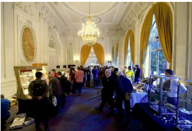
Vue g n rale de la bourse