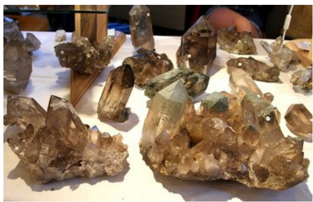
Quartz fum  du massif du Mont-Blanc