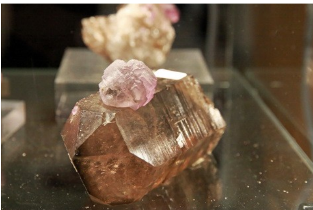
Fluorine violette p le macl e