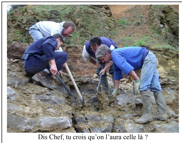
Dis Chef, tu crois qu'on l'aura celle là ?

Pour finir, impossible de ne pas évoquer les fameux sites de La Faye et des Jalerys situés sur la commune de Grury à une dizaine de kilomètres au Sud-Est de Ternant qui ont marqué l'exploitation de l'uranium en France.